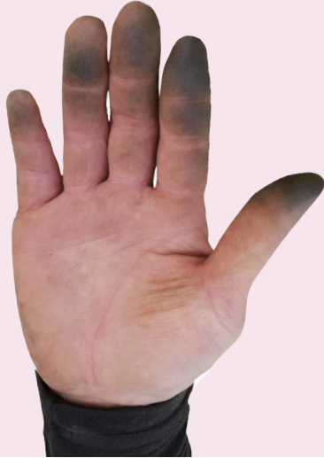
トマトの芽かき作業後の手