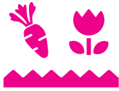
その他野菜、花、 草木、作物のアク