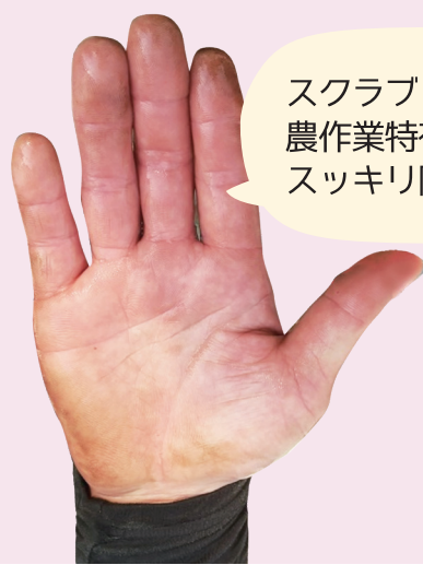
「ファーマーズクリア」で洗浄後